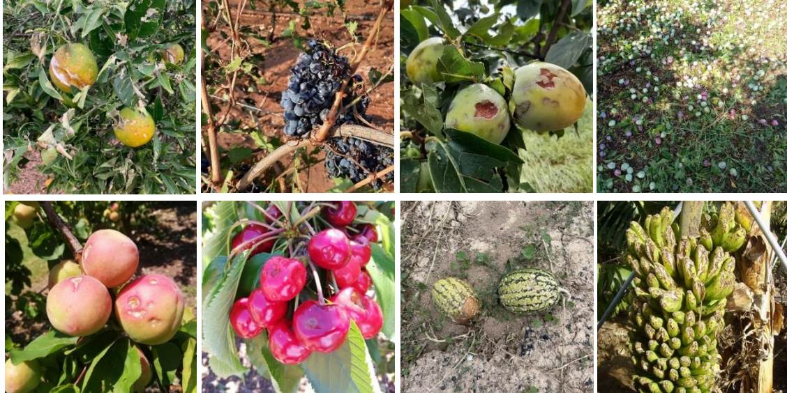
Imágenes de daños causados por el pedrisco sobre producciones agrícolas

Durante 2023, las tormentas se extendieron a lo largo de los doce meses del año, y se recibieron declaraciones de siniestro correspondientes a 215 días con registro de pedrisco. No obstante, destacan los meses de junio y julio , que acumularon casi el 75% de la superficie siniestrada, y muy en especial el primero de ellos, con 319.000 hectáreas siniestradas en numerosos puntos de la geografía española. En concreto, los pedriscos se registraron a diario y de manera continuada entre el 3 de mayo y el 29 de julio, ambos inclusive, lo que suma 88 días consecutivos con tormentas en diferentes zonas de nuestro país.